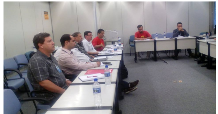
Mesa de negociação na CEMIG