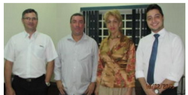
Reinauguração da Sub-sede Triângulo