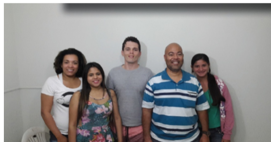
Inauguração Sub-sede - Governador Valadores