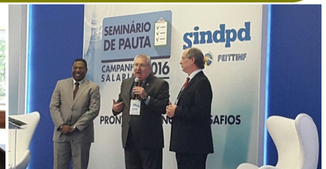
Seminário de Pauta - Campanha Salarial SINDPD