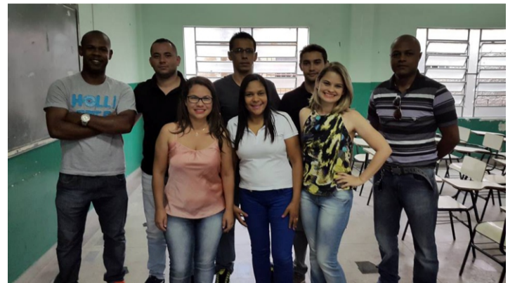
Encontro TST's - Centro Oeste - Nova Serrana/MG