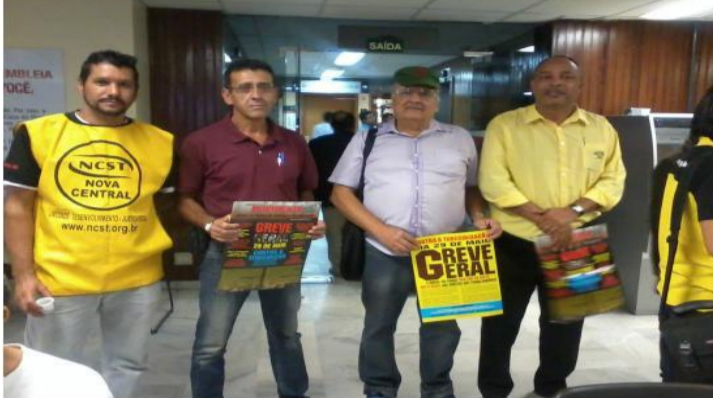
SINTEST-MG participa de audiência pública na ALMG para debater terceirização