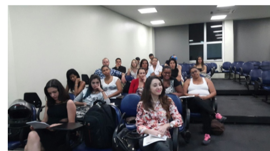
Palestra escola de técnicos de Segurança