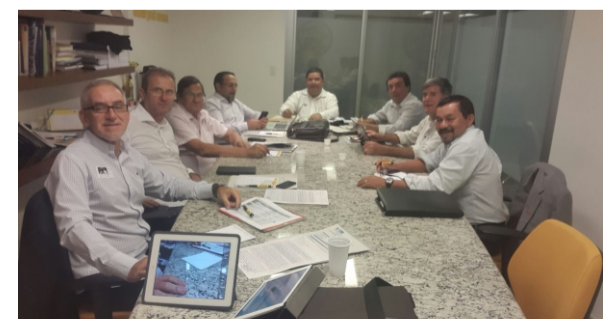
Reunião da bancada de Trabalhadores CTPP