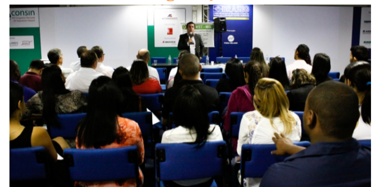
XV Encontro Mineiro dos Técnicos de Segurança do Trabalho