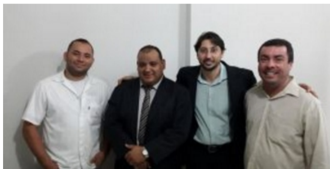
Inauguração da Sub-sede Centro-oeste

Os profissionais admitidos após 1º de agosto receberão um reajuste proporcional aos meses trabalhados. O SINTEST-MG também assinou a Convenção Coletiva dos trabalhadores do Comércio de Bens, Serviços e Turismo de Minas Gerais. Ficou garantido um índice de aumento de 6,23%, que incide sobre os salários de janeiro de 2014.