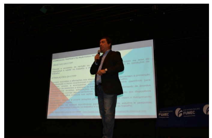
Caravana Proteção /2015