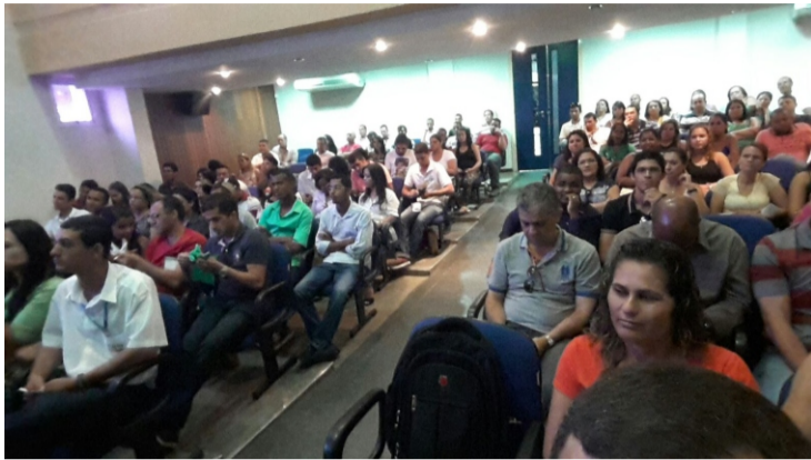
1º Encontro dos Técnicos de Segurança do Trabalho do Norte de Minas

BOLETIM Nº 18 - 15 de Dezembro de 2015 - Ano II