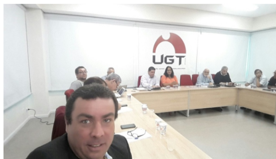
Reunião da CTPP juntamente com o Fórum das Centrais Sindicais -Sede UGT / SP