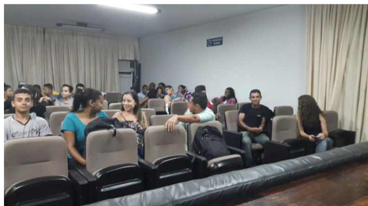
Palestra Escola Ultramig - Belo Horizonte