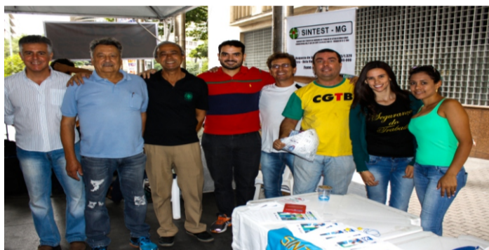
Dia Mundial da Saúde em BH