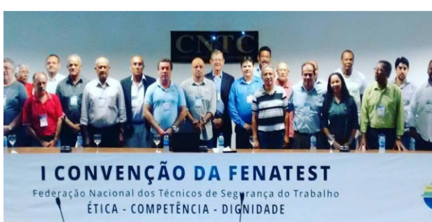
1ª Convenção da FENATEST